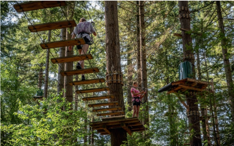
Het klimbos van De Heikamp is voor de durvers.

heerlijke hartige pannenkoeken op tafel. We genieten op het terras van deze prachtige plek bij het bos. ‘Inderdaad prachtig, maar er woont hier niemand in de buurt, dus moeten we, om mensen aan te trekken, wat beleving toevoegen.’ Vandaar dat hier verschillende wandelroutes zijn uitgestippeld, waaronder een liefdespad met kunstige love seats en een prikkelende relatietest. Het klimbos telt ook routes, maar dan tussen de bomen en over touwen, tot wel 20 m hoog.