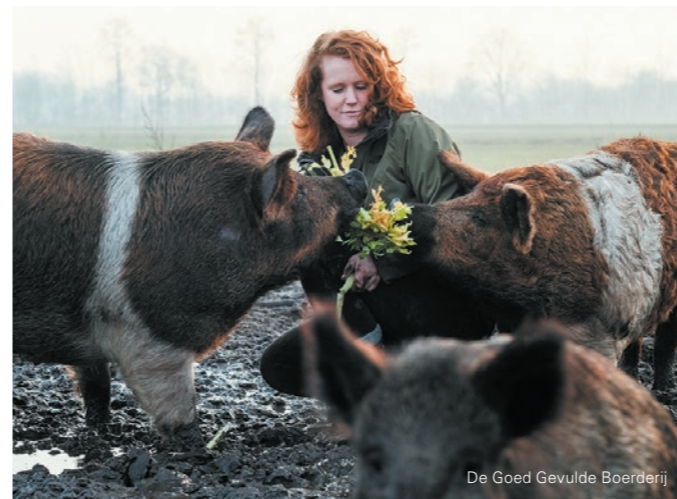
De Goed Gevulde Boerderij

De gemeente Bronckhorst barst van de smaakmakers! Met specialiteiten als verse vis van de Palingrokers en Forellenvijver Breukink, fantastische chocolade van Chocolaterie Magdalena tot kakelverse eieren van Bouwmeester Eieren. Ook aan streekwinkels geen gebrek. De keuze is reuze met maar liefst 13 streekwinkels. In het weekend geniet je van een ambachtelijk biertje bij Bronckhorster Brewing Company of een glas wijn van een van de wijngaarden en wijnboerderijen. Stop onderweg voor zelfgemaakt ijs bij IJsboerderij de Steenoven of tap je eigen fles melk bij een van de melktaps.