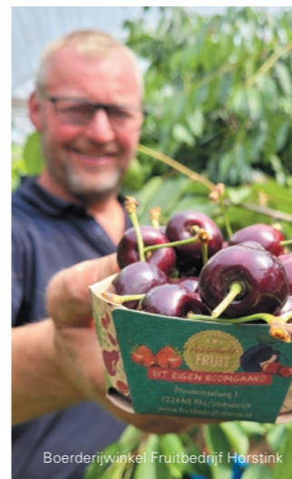
Boerderijwinkel Fruitbedrijf Horstink