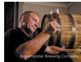
Bronckhorster Brewing Company