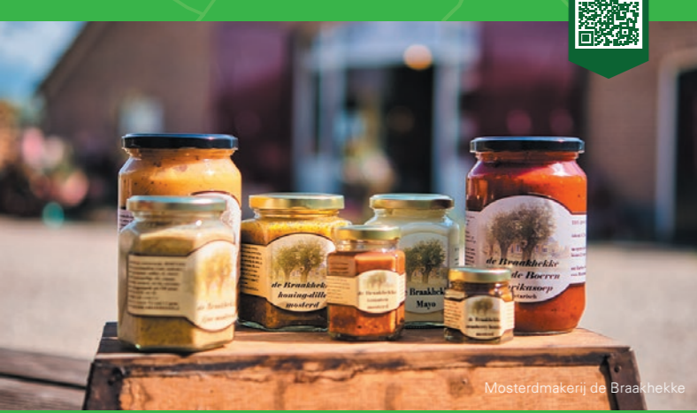
Mostermakerij de Braakhekke

3 FIETSRUTES LANGS ACHTERHOEKSE SMAAKMAKERS LOCHEM | ZUTPHEN | BRONCKHORST