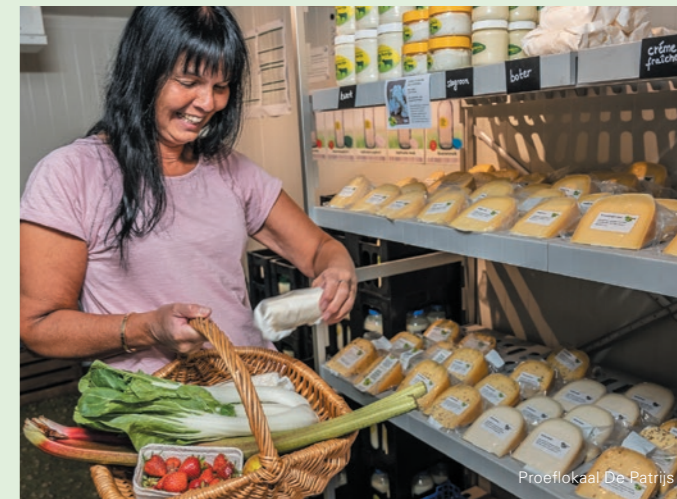
Proeflokaal De Patrijs