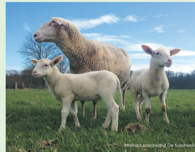
Melkschappenbedrijf De Kooihoek